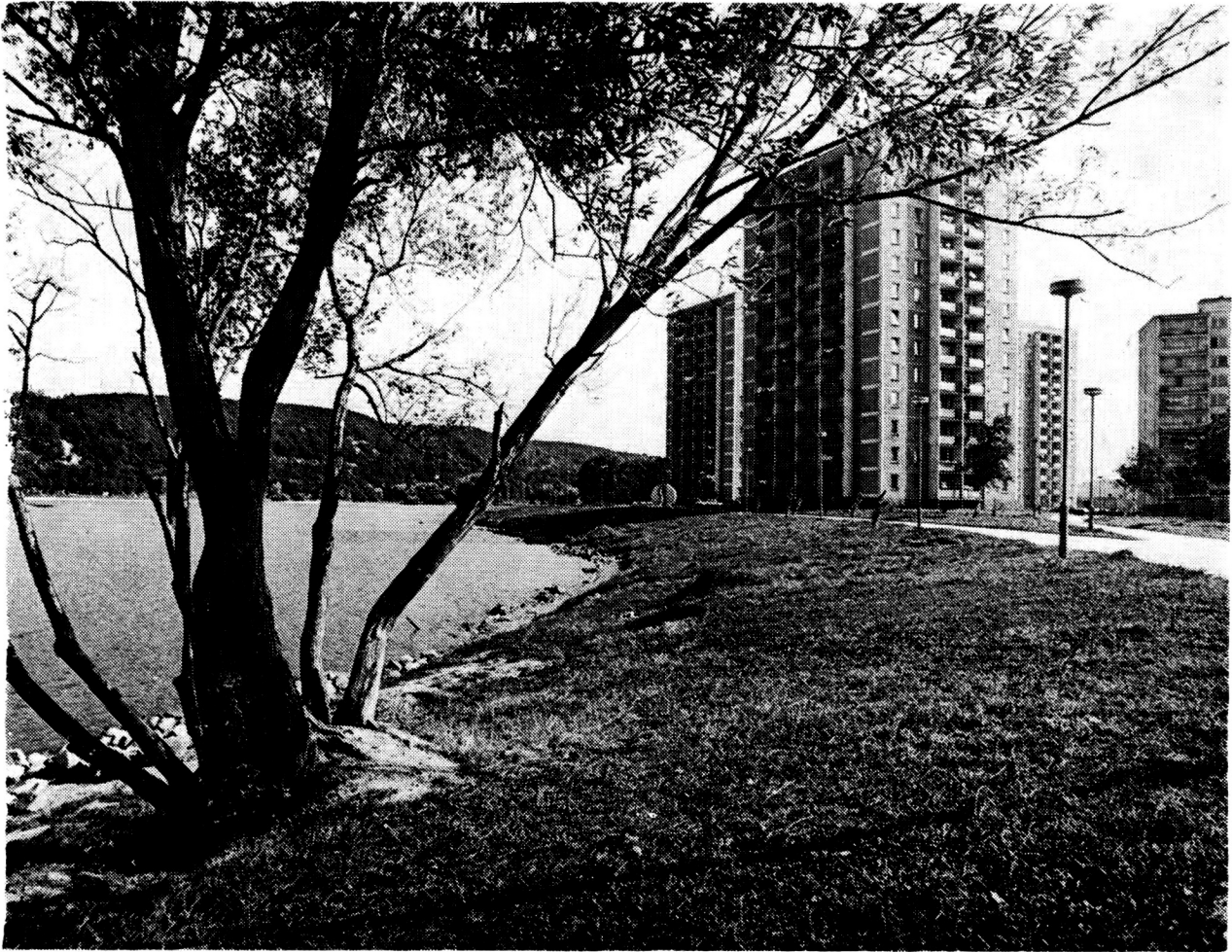
Košice — sídlisko Nad jazerom

nov, ktoré majú efektívne hospodáriť s prírodou a územím) sa proces zobjektívizuje a nadobudne pravidlá. Tým chcem naznačiť, že pôsobenie podnikovej ekonomiky má aj významný priestorový aspekt, ktorý sa doteraz nerešpektoval.