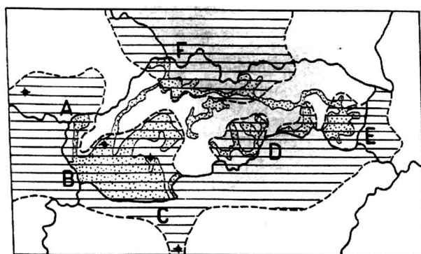
Environmentálne problémy presahujúce štátne hranice