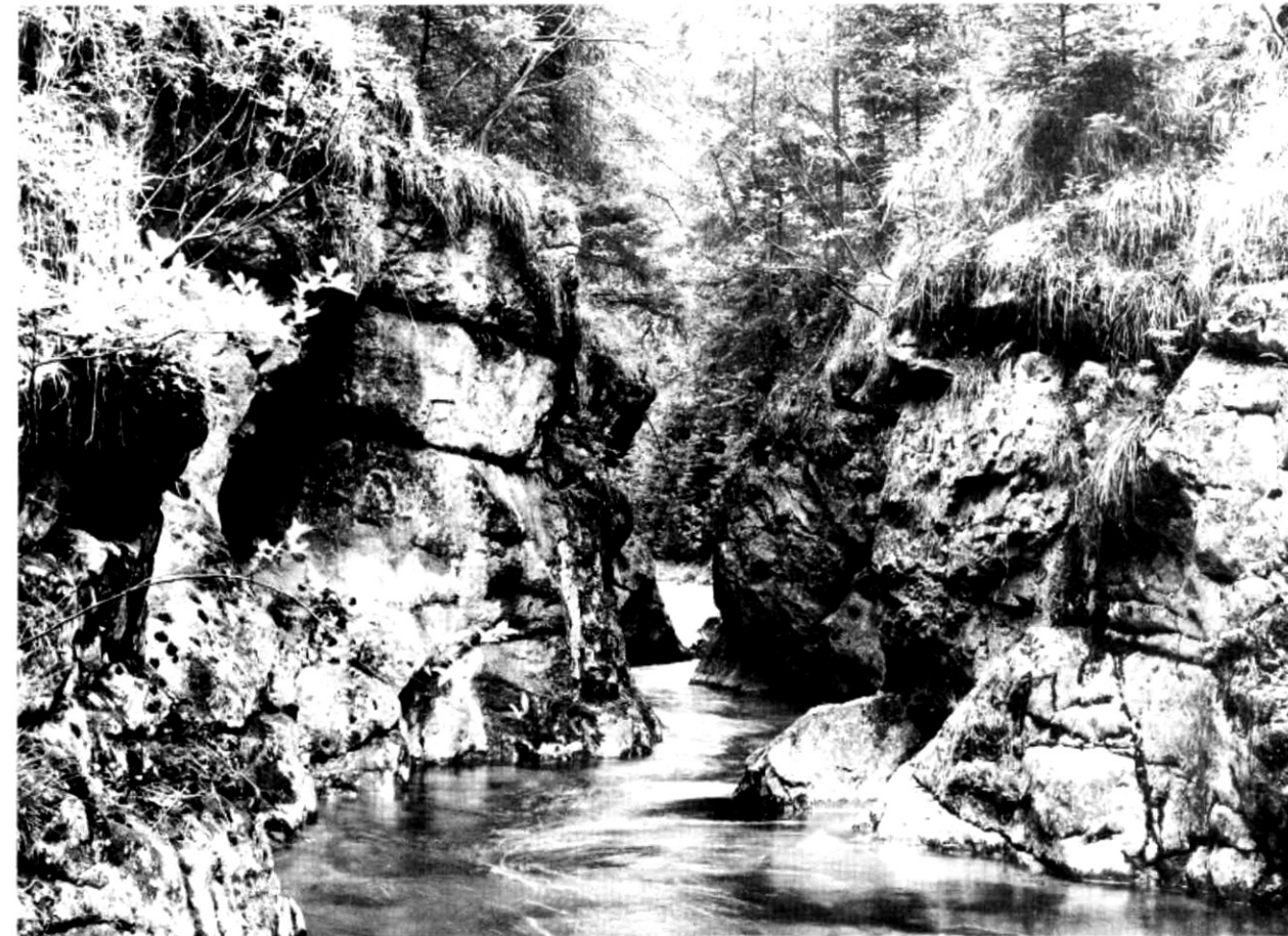
Vodou vymodelovaná tiesňava na Veľkej Bielej Vode v Slovenskom raji