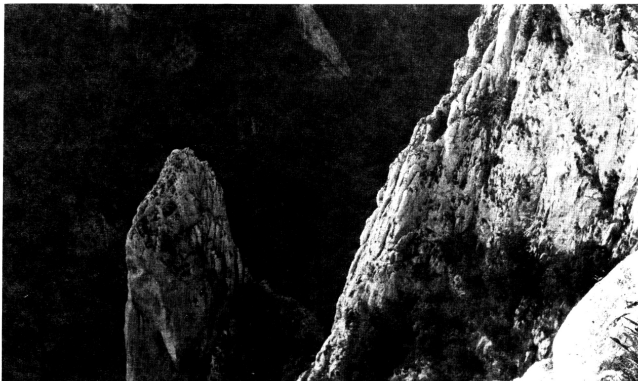
Skalný útvar Cukrová homoľa v ŠPR Zádielska tiesňava

Územie Slovenského krasu poskytuje kvalitné nerastné suroviny. Ich ťažba je jednou z aktivít negatívne vplyvujúcich na prírodné prostredie. Pomerne veľké množstvo (až 64) opustených ťažobných miest bolo založených v minulosti, ale aj v súčasnosti využívané lomy znamenajú nepriemeraný zásah so všetkými priamymi i nepriamymi negatívnymi dôsledkami. Najviac sa prejavujú pri lomoch s veľkou ťažobnou kapacitou, ako sú Včeláre a Gombasek