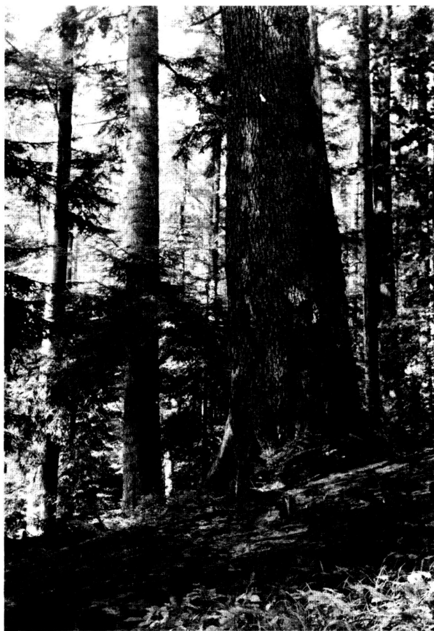
ŠPR Stuzica v CHKO-BR Východné Karpaty

ochrana niektorých biotopov a krajinných typov je nedostatočná. Chýba nám aj aktuálne vyhodnotenie, do akej miery chránené územia pokrývajú potreby druhovej ochrany, najmä ohrozených druhov rastlín a živočíchov.