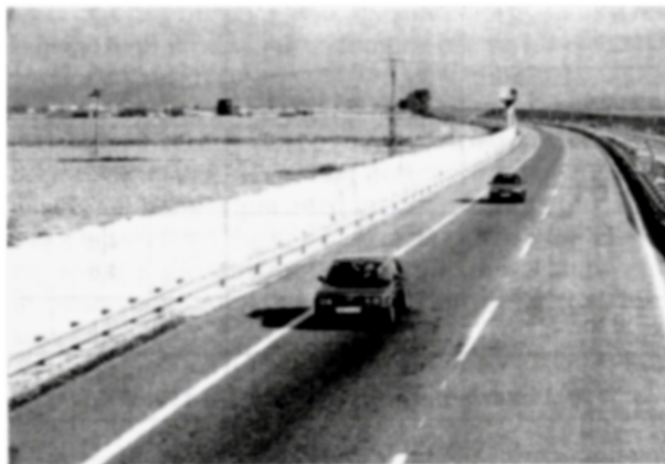
Diaľnica D 61 v úseku Piešťany – Horná Streda

vinnosť posúdiť vplyv diaľnic na životné prostredie pred vydaním územného rozhodnutia stavby.