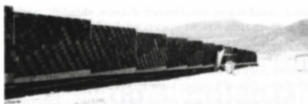
Protihluková stena obce Zamarovce, materiál „Durisol“

• Sociálne vplyvy a využitie územia: sídla – demolácie, zásah do sociálneho prostredia, deliaci účinky