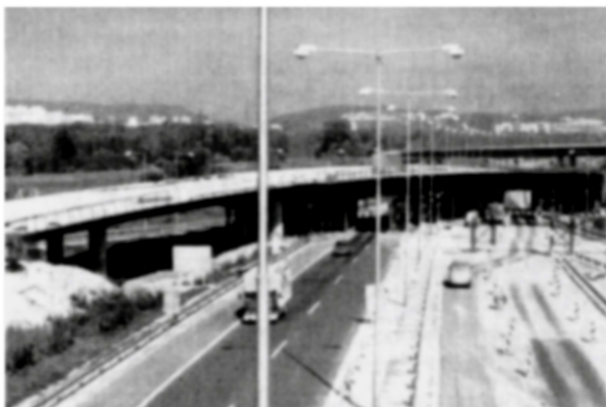
Diaľnica D 2/D 61 v úseku Viedenská cesta – štátna hranica SR/MR, SR/Rakúsko

V koridoroch budúcich diaľnic narástla doprava na cestách od r. 1990 priemerne až o 49 %, čo potvrdzuje oprávnenosť, resp. nevyhnutnosť dobudovania diaľnic v SR. Diaľnice preberajú 60–90 % dopravy z jestvujúcich komunikácií.