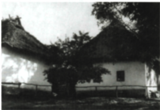
Novobanské štále – dvor vo Veľkej Lehote

sedlovou šindľovou alebo slamenou strechou. Z ľudovej architektúry kopaníc Valaskej Belej sa zachoval zaujímavý archaický príklad Vydra (1925) – obielený zrubový dom s vysokou slamenou strechou.