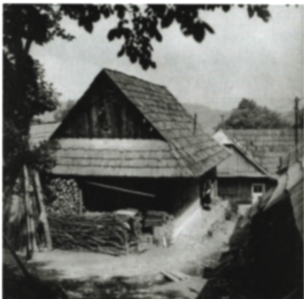
Drevenica v osade Jánošovia, údajnom rodisku Jura Jánoška (časť obce Terchová)