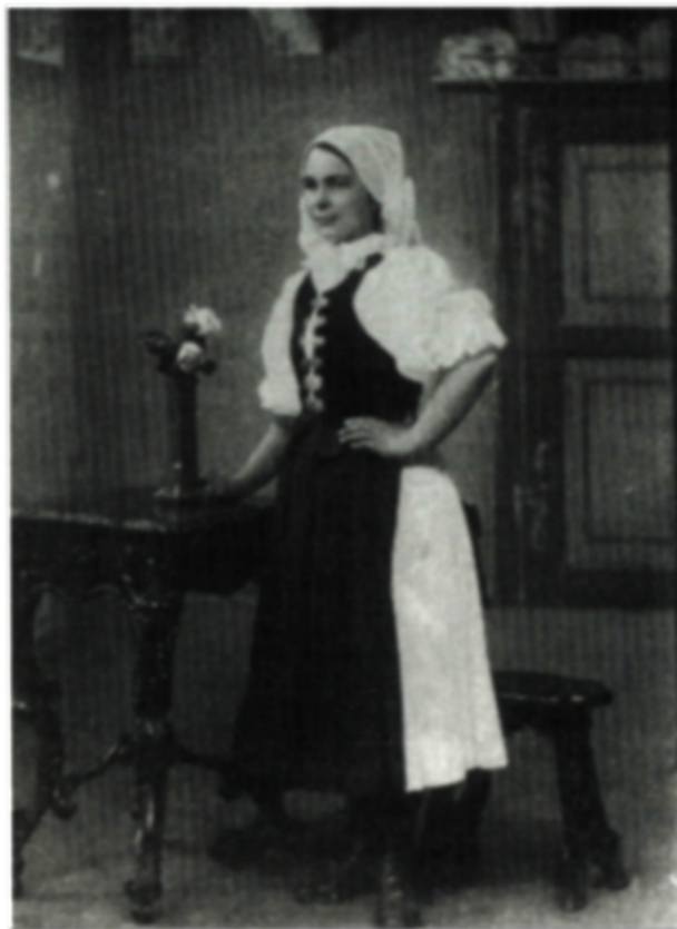
Mladé dievča v brezovskom kroji (r. 1912)

• Belianske kopanice (lazy) v Strážovských vrchoch (historicky v Nitrianskej stolici). Ide vlastne o samostatný malý ostrov rozptýleného osídlenia. Obyvatelia sa živili sklenárstvom a oknárstvom. V tejto oblasti sa stavali hlinené a zrubové domy (bielené vápnom) so