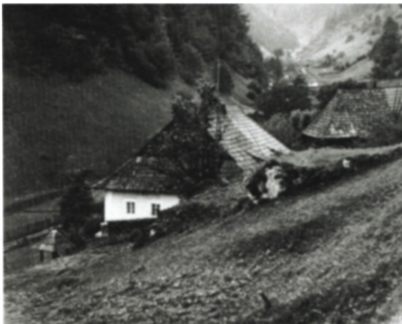
Osada Rybô v Starohorských vrchoch