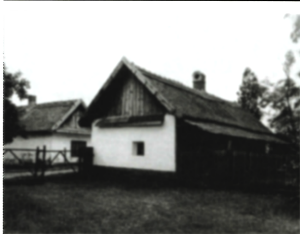
Typ dolnozemskeho osídlenia – Strieborné Vinice pri Sarvaši

sa nachádza najvyššie položená samota na Slovensku – observatórium na Lomnickom štíte – vo výške 2634 m n. m.