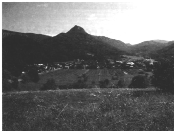
Bralo Cigánka s hradom Muráň

Národný park Muránska planina, ako aj ďalších šesť národných parkov Slovenska (Tatranský národný park, Pieninský národný park, Národný park Nízka Tatry,