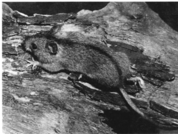
Myšovka vrchovská – reliktný druh žijúci na území NP