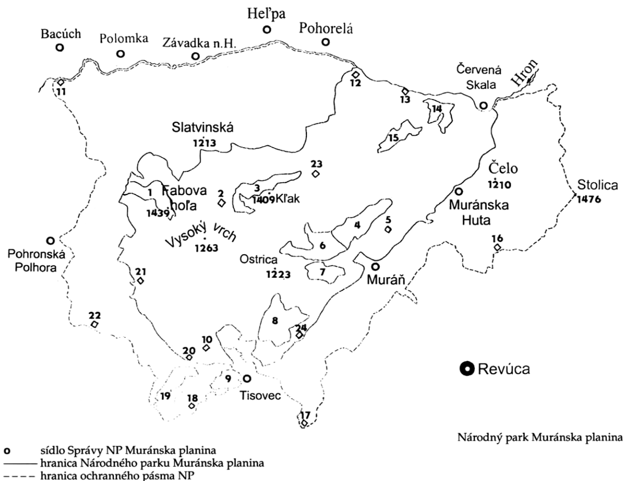
Národný park Muránska planina

Národné prírodné rezervácie: 1. Fabova hoľa, 2. Malá Stožka, 3. Veľká Stožka, 4. Poludnica, 5. Cigánka, 6. Hrdzavá, 7. Javorníková, 8. Sarkanica, 9. Hradová, 10. Kášter.