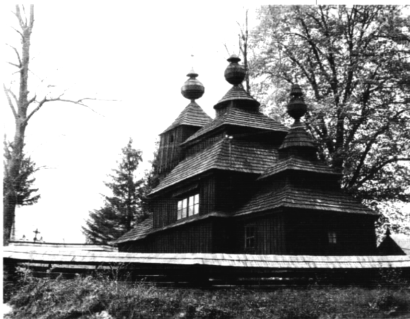
Drevený kostolík východného obradu lemkovského subtypu s dominanciou západnej veže v Bodrudžali

zantská) kultúra. Ide o vrchol ľudovej umeleckej a architektonickej tvorby Rusínov na našom území. Tieto stavby charakterizuje trojpriestorovosť a trojvežatosť, v niektorých prípadoch dvojvežatosť. Ich podstatná časť patrí k lemkovskému subtypu, pre ktorý je príznačná dominancia západnej veže, postavenej nad babincom (Kovačovičová-Puškárová, Puškár, 1971). Tieto stavby, pochádzajúce zväčša zo 17. a 18. storočia, nachádzame vo Fričke, Jedlinke, Kožanoch, Krivom, Lukove-Venecii a Tročanoch (v okrese Bardejov), Hrabovej Roztoke, Kalnej Roztoke, Ruskom Potoku, Topoli, Uličskom Krivom (v okrese Snina), Potokoch (v okrese Stropkov), Bodrudžali, Dobroslave, Hunkovciach, Korejovciach, Krajnom Čierne, Ladimírovej, Miroli, Príkrej a Šemetkovciach (v okrese Svidník). Viaceré kostolíky boli premiestnené do skanzenov alebo múzeí v Bardejovských kúpeľoch, Humennom, Svidníku, Starej Lubovni, Košiciach (z Malej Poľany, Mikulášovej, Zboja, Kožuchoviec, Matysovej, Novej Polianky a Novej Sedlice). Odlišným subtypom je bojkovský, pre ktorý je príznačná dominancia prostrednej veže nad loďou. Jediným v regióne je bojkovský kostolík Ochrany Bohorodičky z r. 1938 v Nižnom Komárniku. Za osobitný subtyp možno považovať drevené kostolíky vybudované na mieste starších sakrálnych stavieb, zničených počas 1. svetovej vojny (v Hutke, Varadke, Vyšnej Polianke). Zjednocujúcou črtou lemkovských a bojkovských kostolov je bohatá výzdoba s citom pre harmóniu s okolitým prostredím. Dominant-