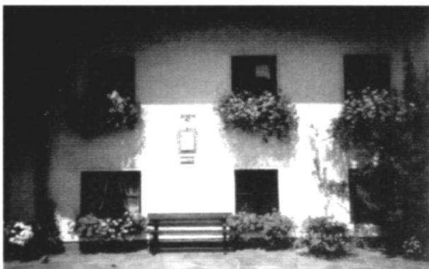
Príťažlivý vidiecky dom s množstvom kvetov – príklad zo zahraničia

ako prejav starostlivosti o svoj domov. Úlohou architektonickej obnovy je vytvoriť pekné námestia, ústredné priestranstvá na oživenie spoločného života obce. Obnovu dediny charakterizuje dotváranie verejných priestranstiev, lebo práve tie sa stali miestom odcudzenosti a nevšímavosti. Obnova dediny to je starostlivosť o každý kúsok zeme, o udržiavanie trávnikov a priedomie bez veľkých plotov.