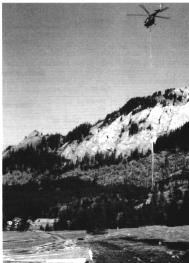
Dimenzia krajinného priestoru sa člení na krajinné prvky

(Príklad: Spásanie spôsobuje pri prekročení únosnosti indikačné zmeny na úrovni dimenzií spoločstiev – spôsobuje zmeny – vyvolávajúce erózie, tvorbu prítí v pasienkovom a lúčnom hospodárstve. Poľnohospodárska výroba spôsobuje zmeny (prekročenie únosnosti) na úrovni krajinných priestorov/segmentov; cesty, hnojiská s ich vplyvmi na vodné sys-