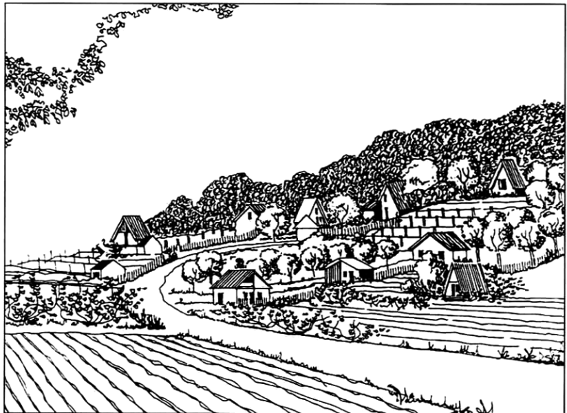
Krajinné zónovanie – grafická analýza jednotlivých zón (záhrady a sady)