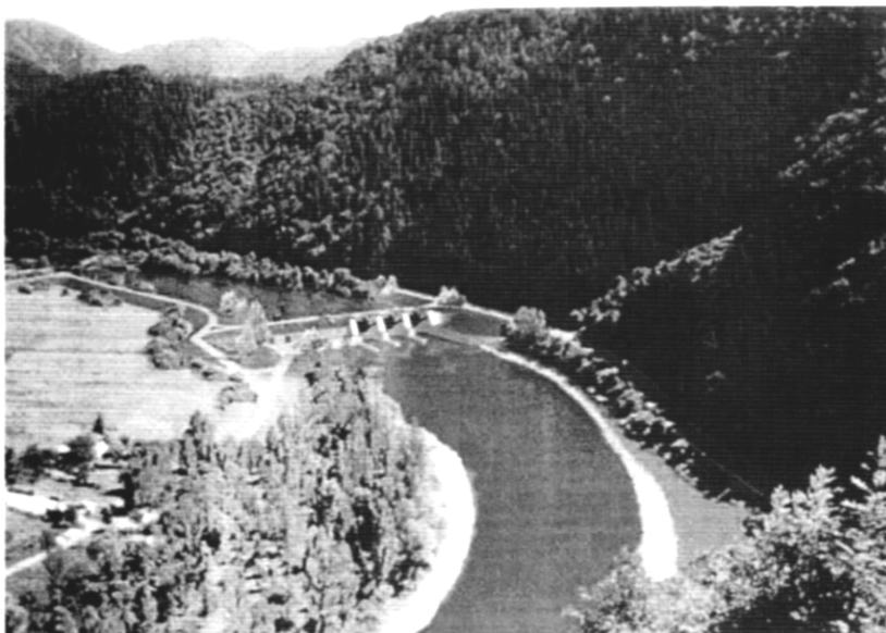
Navrhované vodné dielo Nezbudzská Lúčka, ktoré je v rozpore so záujmami ochrany prírody (fotomontáž)