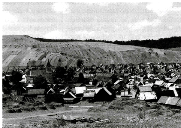
Intravilán Liptovskej Tepličky – v popredí “stodolište“