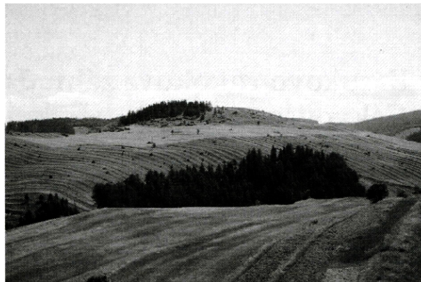
Historické poľnohospodárske štruktúry v extraviláne Liptovskej Tepličky

Dobrovodská, M., 1997: Historical Agricultural Utilization of Landscape in the Cadastre of Liptovská Teplička, Sustainable Cultural Landscape in the Danube-Carpathian Region. In: Proceedings of the II. International Conference on Culture and Environment, Sustainable Cultural Landscape in the Danube-Carpathian Region. Nadácia UNESCO, Banská Štiavnica, p. 1–4.