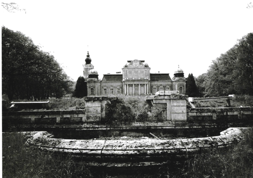
Barokový kaštieľ a parter parku v Spišskom Hrhove

Krajina je dedičstvom a kultúrna krajina i kultúrnym dedičstvom celého národa. V tomto zmysle hodnotíme