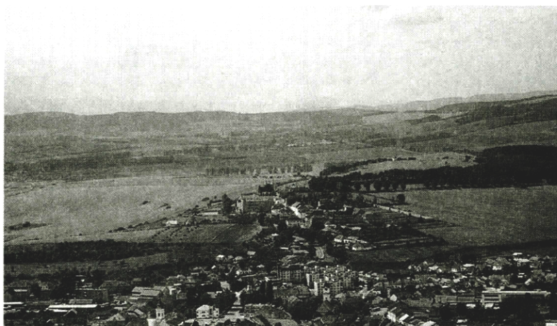
Spišská Kapitula a časť Spišského Podhradia

Ochrana a kultivácia prírodných a kultúrnych hodnôt krajiny znamená chrániť a aktívne udržiavať: