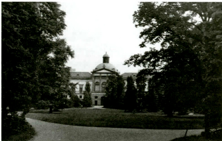
Topolčianky – zámok a park

národných parkov, 16 chránených krajinných oblastí, 179 chránených lokalít, 354 prírodných rezervácií, 231 národných prírodných rezervácií, 229 prírodných výtvorov a 38 národných prírodných výtvorov. Pozoruhodných je 15 vyvieracích prameňov v krasových útvaroch a 514 doteraz evidovaných chránených a pamätných stromov. Druhovo bohatá flóra a fauna s jej výškovou a stanovištnou premenlivosťou tvoria špecifický krajinný obraz, ponuku na poznávanie, obdivovanie, edukáciu a široké spektrum rekreačných aktivít a oddych.