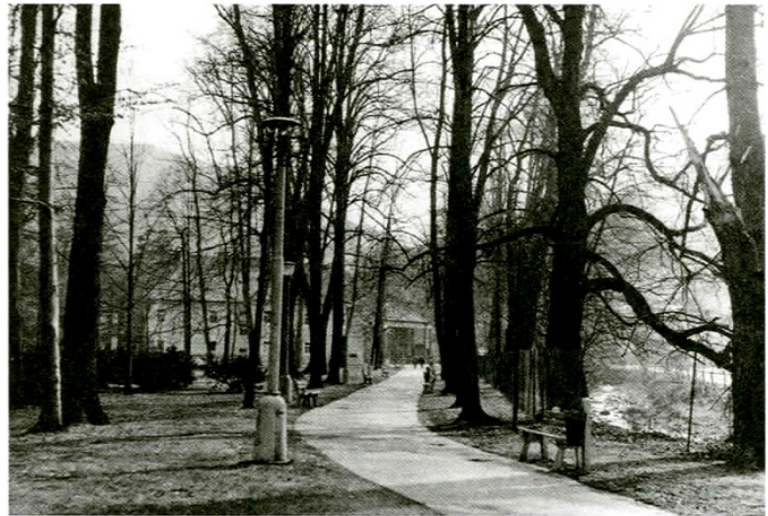
Kúpeľný park v Sklených Tepliciach

Okrem toho kúpeľné lesy, lesné parky a lesy v okolí liečebno-preventívnych objektov tvoria spolu 4 522 ha (Švec, 1997). Mnohé z týchto rekreačných lesov prešli zo štátnej do inej formy vlastníctva (súkromného, cirkevného, urbárneho, obecného a pod.), čím sa vytvorili podmienky na nové formy podnikateľských aktivít. Reálny stav obhospodarovania, technickej vybavenosti a služieb v prímestských parkových lesoch však v súčasnosti možno označiť za stagnáciu až degradáciu a žiada si nevyhnutné oživenie. K pozitívnym javom a trendom v tvorbe rekreačných zariadení miest patrí najmä zriaďovanie objektov agroturistiky, obnova niektorých historických parkov a kaštieľov s novou ponukou služieb