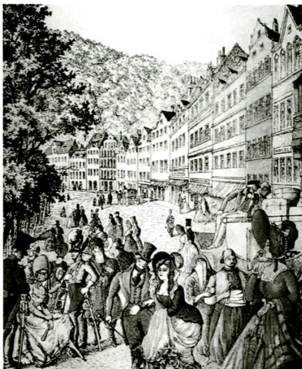
Karlove Vary v polovici 19. storočia a dnes

• Prírodné – zahŕňujú prírodný rekreačný potenciál spočívajúci v klimatických a geografických podmienkach, vodných prvkoch (rieky, jazerá, moria), ďalej minerálne a termálne pramene, prírodné výtvory, prvky rastlinstva a živočíšstva, chránené prírodné územia a pod. Svetoví experti cestovného ruchu vytypovali 39 najvýznamnejších atraktivít, z ktorých Slovensko má všetky okrem mora. Máme ca 1500 minerálnych prameňov, z toho 117 termálnych, ktoré tvoria potenciál na kúpeľnú liečbu, rekreáciu a oddych (vrátane liečebného pitného režimu). Na Slovensku sa v súčasnosti využíva 22 prírodných liečebných kúpeľov. Na našom území je 7