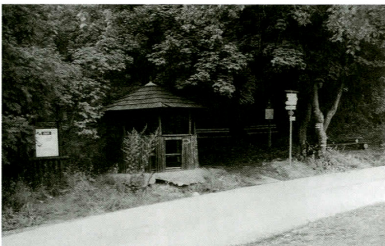
Besiedka a križovatka chodníkov v lesnom parku Zobor