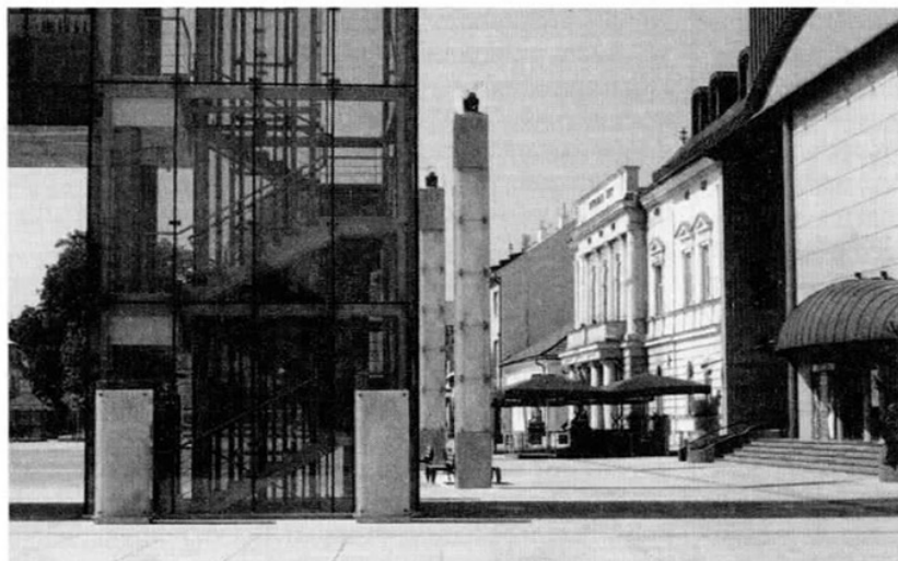
Nové námestie v Martine, pohľad od severu