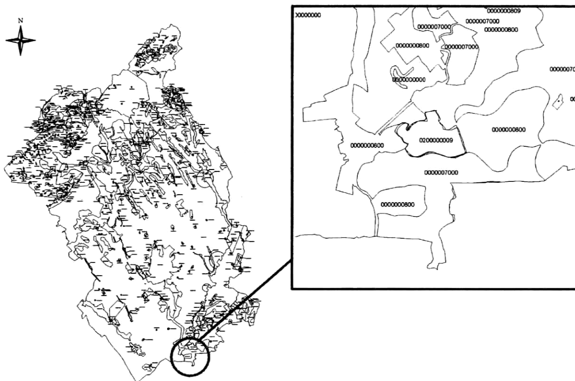
3. Príklad vzniku nelogických kombinácií pri topologickom prekrytí (výrez z mapy Syntéza pozitívnych prvkov)

Týka sa to hlavne syntézy alebo superpozície vstupných analytických podkladov. Pri tvorbe podobných podkladov sa musí klásť dôraz na ich štandardizáciu už v prípravnej fáze. Spracovanie KEP treba prispôbiť aj existujúcemu informačnému systému o území, resp. systému, ktorý by využíval informácie obsiahnuté v tomto pláne. Pri spracúvaní KEP je vhodné širšie využívať DPZ (leteckých a družicových snímok) pri mapovaní súčasného využitia krajiny, druhovej skladby drevín, erodovaných území a pod.