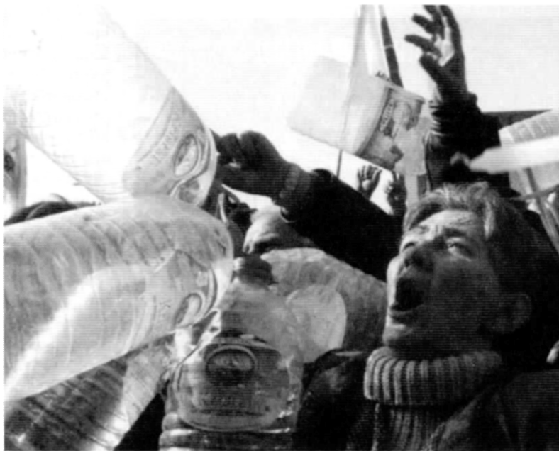
Nedostatok pitnej vody začína nadobúdať globálne rozmery

Liberalizácia sa obzvlášť markantne prejavuje na finančných trhoch. Niektorí autori hovoria o novej etape kapitalizmu, ktorej hnacími momentmi sa stali finančná globalizácia a IKT, čo všetko urýchľuje kapitálové toky. Popri podnikoch sa na ekonomických transakciách podieľajú aj ďalšie periférne subjekty: komerčné banky, auditorské kancelárie, ratingové agentúry, špekulatívne investičné fondy a pod. Ak v prvej polovici 80. rokov predstavovala celková hodnota finančných tokov na svetových finančných trhoch 10 – 15násobok objemu svetového obchodu (exportu), r. 1996 bol hodnotový objem transakcií na svetových finančných trhoch až 58-krát väčší ako hodnota svetového exportu, z čoho až dve tretiny pripadali na finančné operácie viac-menej odtrhnuté od reálnych tovarových tokov a žijúce akoby vlastným životom (Šikula, 1999). Ide prevažne o špekulatívne transakcie orientované na vývoj i aktívne ovplyvňovanie menových kurzov, úrokových mier, kurzov účastín a ďalších cenných papierov. Tieto aktivity zamerané na čoraz väčšiu maximalizáciu návratnosti kapitálových vstupov zneisťujú finančný trh i vo svetovom meradle a spúšťajú burzové krachy, recesné až krízové procesy. Z hľadiska koncepcie udržateľného rozvoja sú faktorom destabilizácie ekonomiky vo svete a zjavnej prioritizácie čo najväčších bezprostredných finančných efektov pred záujmami zabezpečenia dlhodobého udržateľného rozvoja.