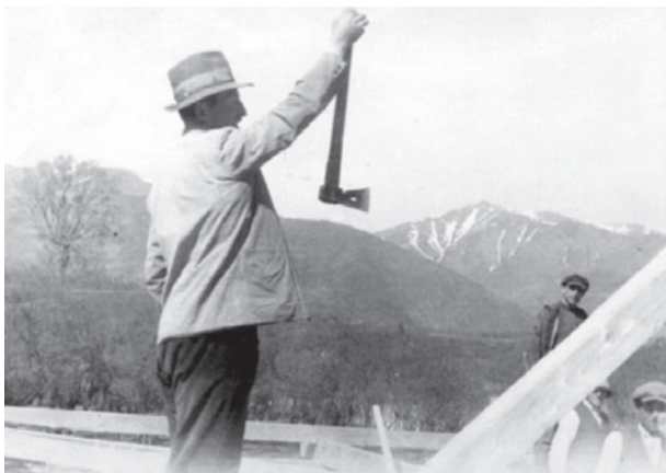
Popri svojej práci na gazdovstve sa tesárski majstri zapájali napríklad do stavby obecného domu (1934).