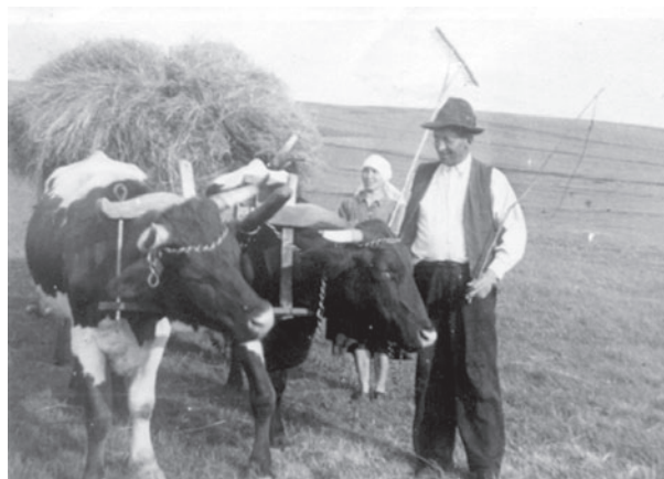
Zväžanie sena na Liptove (1942).

Ochrana krajiny je prevažne spojená s ekologicky optimálnym využívaním územia, pričom sa kladie dôraz na ochranu biodiverzity, ekologickú stabilitu priestorovej štruktúry krajiny, ochranu a racionálne využívanie prírodných zdrojov, tvorbu a ochranu územného systému ekologickej stability, tvorbu a ochranu životného prostredia. V súčasnosti však prevažuje neekologické hospodárenie, čo spôsobuje vytváranie monofunkčnej pretechnizovanej narušenej a esteticky rušivo pôsobiacej krajiny. Je charakteristická veľkoplošným poľnohospodárstvom, silným stupňom industrializácie, nešetrnou lesohospodárskou činnosťou a pod. Tradičné formy hospodárenia, ktoré sa vyznačujú zväčša šetrným spôsobom obhospodarovania krajiny, sa vyskytujú v súčasnosti už len ojedinele, preto im treba venovať zvýšenú pozornosť. Územie s tradičným spôsobom využívania predstavuje pre súčasnú (kultúrnu)