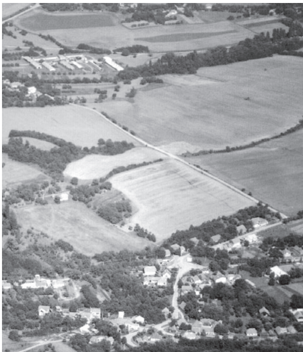
Krajina s rozptýleným osídlením kopaničiarskeho typu – Bzince pod Javorinou.

movládnych organizácií (napr. Slovenskej asociácie pre krajinnú ekológiu, Národného trustu Slovenska) a ďalších odborníkov zabezpečili odborný preklad, zároveň analyzovali princípy a záväzky vyplývajúce z Dohovoru a porovnali ich s platným právnym poriadkom SR.