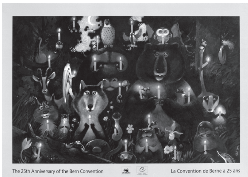
Rada Európy: 25. výročie Bernskej konvencie. Ekoplagát 2005.

jatie environmentálnej zodpovednosti za iných vyžaduje, aby sa iné tvory prestali vnímať len ako majetok či „veci“, ale aby boli považované za súčasť spoločenstva života na Zemi, lebo v ňom majú význam a hodnotu nielen pre človeka, ale aj zatiaľ nie úplne spoznanú hodnotu v rámci ekosystémov a pre fungovanie biosféry. Zem je nie vlastníctvom ľudí, ale ich domovom. Subjektívne prijatá environmentálna zodpovednosť motivuje človeka k starostlivosti o životné prostredie a k tomu, že chce (nielen musí) dodržiavať jestvujúce sociálne a právne pravidlá jeho ochrany, ba aj k tomu, aby aj od politických a ekonomických elít vyžadoval dodržiavanie a zdokonaľovanie týchto pravidiel.