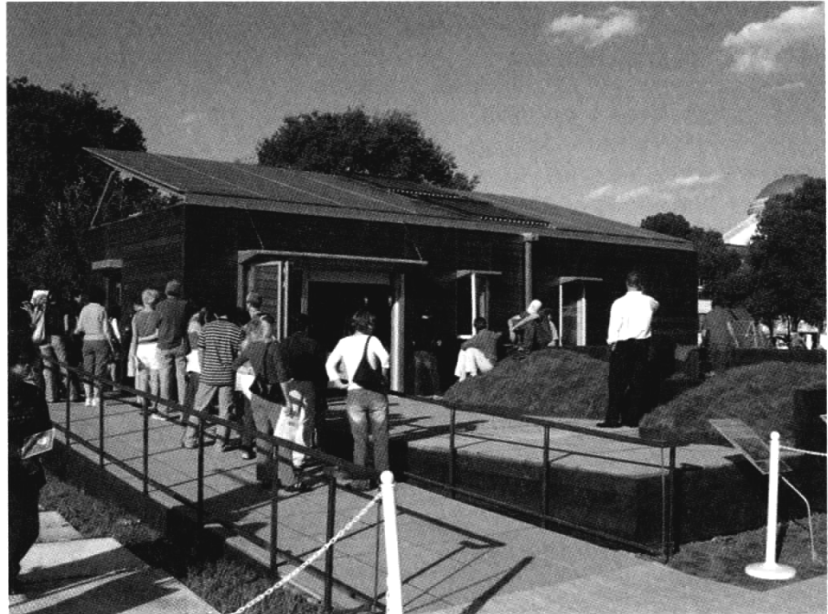
Slnecný dom tímu Cornell University (hore), ktorý sa umiestnil na 2. mieste a tímu California Polytechnic University (dolu), ktorý bol tretí na Solar Decathlon 2005