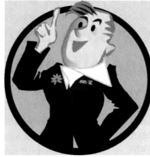
IPAM Joe – virtuálny pomocník

máhajú identifikovať a sústrediť sa na problém a najaktuálnejší stav chráneného územia. Štruktúra samohodnotenia vyplýva zo životného cyklu chráneného územia (prípravná etapa, plánovanie, predchádzajúci manažment) a krízovej kontroly 25 oblastí aktivity. Výsledkom takejto analýzy je správa o vývoji chráneného územia s dôrazom na nedostatky v jeho plánovaní a manažmente a štandardizované odporúčania. Databáza poznatkov obsahuje rozsiahle potrebné informácie, ako sú správy, projekty, organizácie, personál, najlepšie skúsenosti atď. Návštevník ju môže využívať i pridať do nej materiál. K dispozícii je aj slovník najdôležitejších technických výrazov v piatich jazykoch (anglickom, českom, nemeckom, slovinskom a chorvátskom). Virtuálny pomocník – IPAM Joe – pomôže vyhľadať, resp.