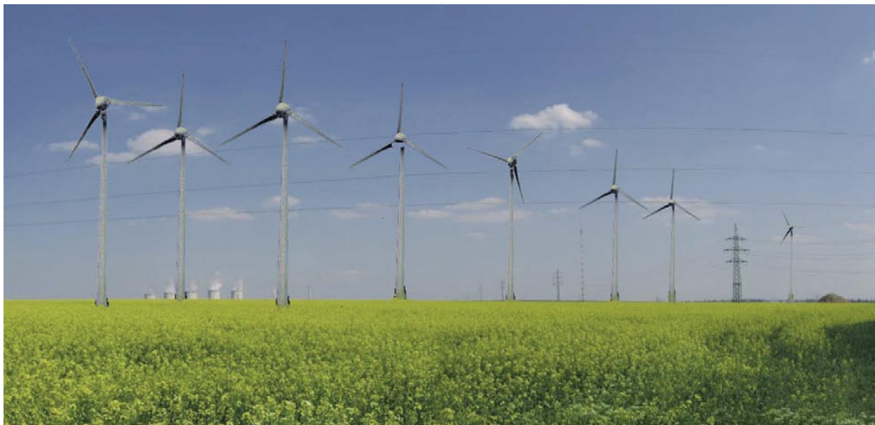
Navrhovaný veterný park Jaslovské Bohunice, Malženice, Radošovce s účasťou verejnosti – pohľad od Radošoviec na juhovýchod, v pozadí jadrová elektrárň Jaslovské Bohunice (variant I a II). Foto: Ondrušová, 2006.

považuje skutočnosť, že celý proces je otvorený demokratickej kontrole. Aspekt demokratickosti spočíva predovšetkým v umožnení širokej účasti verejnosti, vrátane ostatných subjektov, ktoré sa na posudzovaní zúčastňujú. Verejnosť má na Slovensku zákonné právo byť dostatočne informovaná o všetkých súvislostiach navrhovaného strategického dokumentu alebo navrhovanej činnosti, má právo vysloviť sa k rôznym spôsobom jej riešenia a vystupovať ako rovnocenný partner voči všetkým subjektom procesu posudzovania. Z toho súčasne vyplýva rovnaký diel zodpovednosti za vlastné postoje, korektnosť a serióznosť prístupov k posudzovaniu, ako aj za kontrolu dodržiavania prijatých rozhodnutí pri realizácii navrhovanej činnosti (Gindlová, Petříková, Kusý, 1999).