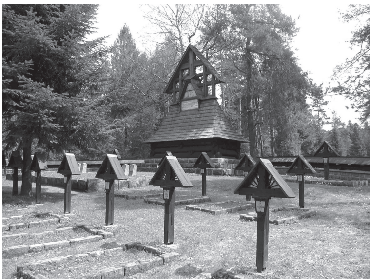
Vojenský cintorín č. 60 na Magure v Maľastovskom priesmyku.

zábleskami ľudovej múdrosti. Jeho rakúsko-uhorskému vlastenectvu už nikto neverí.