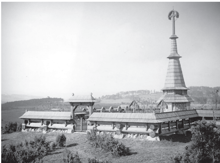
Cintorín č. 55 v Gładyszówe dnes leží v hustom lese.

Neobyklé bolo aj to, v akej miere používal drevo na výstavbu cintorínov. Skutočnosť, že okolité dedinské cintoríny i samotné kostoly (ktoré väčšinou pri bojoch vyhoreli) boli takisto drevené, viedenský