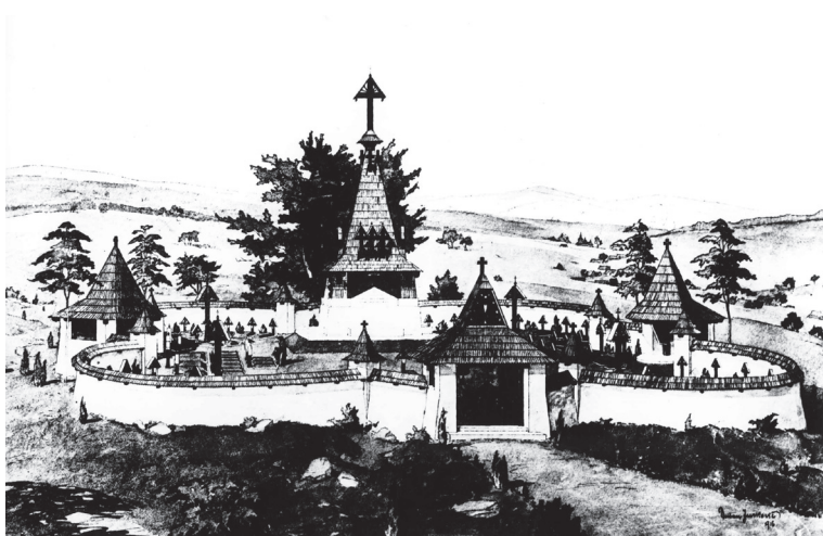
Pôvodný projekt cintorína č. 4 v Grabe. Kresba: J. Kašpar, 1916