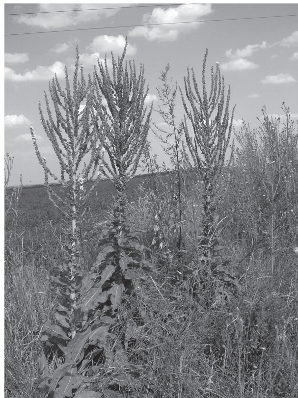
Obr. 3. Demografický monitoring divozela úhladného ( Verbascum speciosum ) prebieha už od osemdesiatych rokov 20. storočia (Dvory nad Žitavou, 2005).