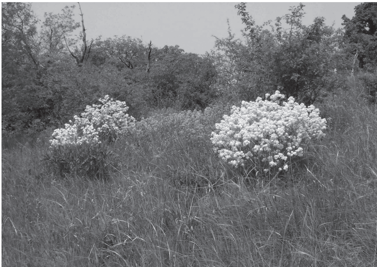
Obr. 2. Katran tatársky ( Crambe tataria ), jeden z mála druhov, o ktorom máme dostatok demografických údajov (Mužla, 2004).

Taxóny, pri ktorých v súčasnosti nemáme dostatok presných dát o populáciách, budeme hodnotiť v novom červenom zozname podľa tzv. odhadnutých údajov ( estimated ), teda údajov založených na výpočtoch vychádzajúcich napríklad zo štatistických predpokladov o zbere údajov alebo z biologických predpokladov o vzťahu medzi istou pozorovanou premennou (napr. indexom abundancie) a cieľovou premennou (napr. počtom dospelých jedincov). V takýchto prípadoch využijeme tiež hodnotenie