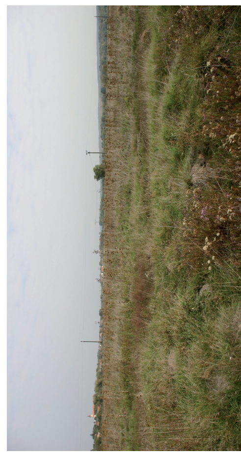
Najznámejšie chránené slanisko na Slovensku: Národná prírodná rezervácia Kamenínske slanisko; vplyvom pošĕkodenia vodného režimu a absencie tradičného obhospodarovania je v súčasnosti vegetácia silne deĕradovaná a viaceré druhy uvádzané z minulostí tu už vyhynuli (2007). (obrázok k článku Dítě, D. a kol. na strane 256)