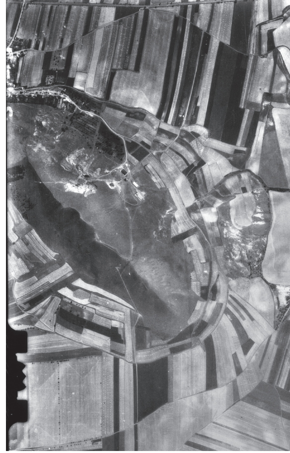
Letecké snímky krajinné mozaiky kopce Raná, kde se historicky i súčasne vyskytuje syseľ obecný a na ktorých je patrná rozdiľnosť využívaní krajiny ľľovĕkem v rozmezí 73 let: (vľavo) letecký snímek z roku 1938, zdroj: Vojenský geografický a hydrometeorologický úřad, Dobruška; (vpravo) letecký snímek z roku 2011, zdroj: AOPK ĀR (obrázky k článku Mináříková, I. a kol. na straně 249)