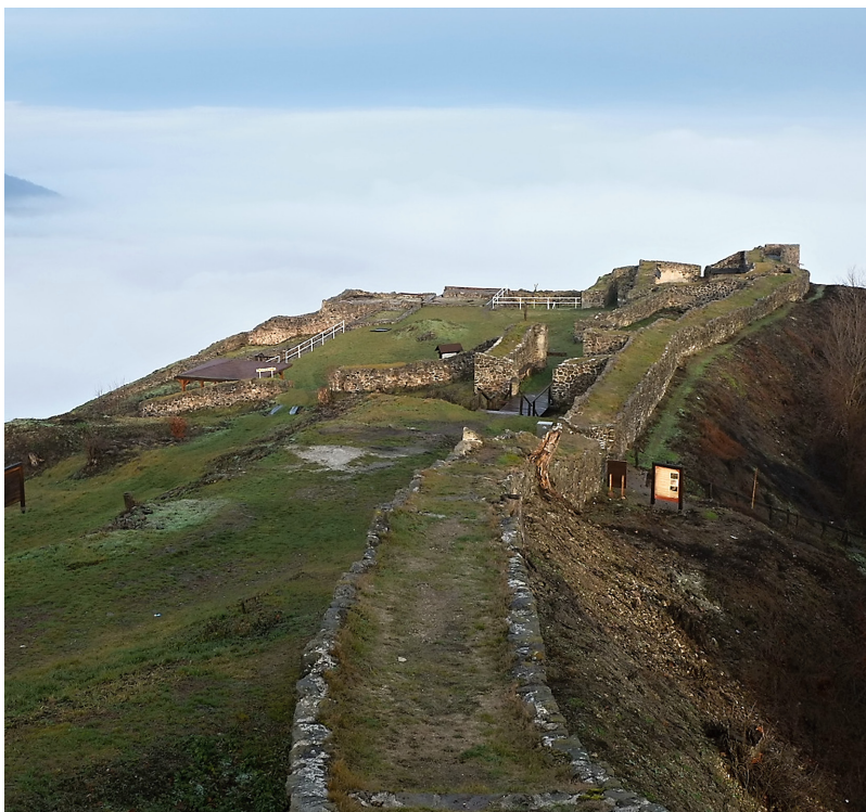
Obr. 2. Pohľad na tzv. Dončov hrad (Pustý hrad vo Zvolene, 2013).