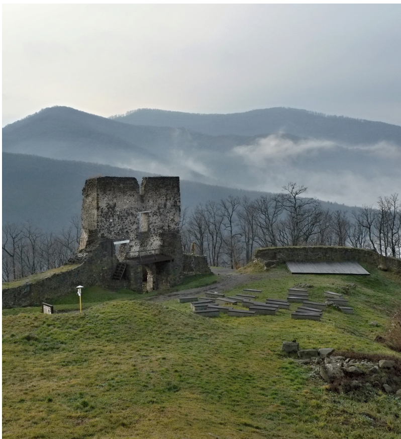
Obr. 3. Pohľad na hlavnú vstupnú bránu Horného hradu a mobiliár z rokov 2011 – 2012 (Pustý hrad vo Zvolene, 2013).

ložený v mestskej účtovnej knihe v roku 1551, kde sa spomína splatenie dlhu medzi zvolenskými mešťanmi kvôli viniciam na Starom hrade. Dedukujeme z toho, že okolie hradu bolo ešte aspoň sčasti odlesnené a panovali tu priaznivé mikroklimatické podmienky, ktoré Zvolenčania vedeli využiť napr. na pestovanie hrozna. Ďalší príklad je z roku 1557, keď mesto zaplatilo želiarom, ktorí okolo poľa pod Starým hradom opravovali mestský plot. Zo zápisov nevieme, či vinica a pole spolu súviseli, resp. pravdepodobne nemali spoločného majiteľa. Nepoznáme, žiaľ, ani ich približnú polohu. Pri ich lokalizácii Maliniak (2009) uvažuje o nižšie položených pozemkoch v blízkosti mesta, ale vylúčiť nemožno ani vyššie položené lokality v blízkosti hradu.