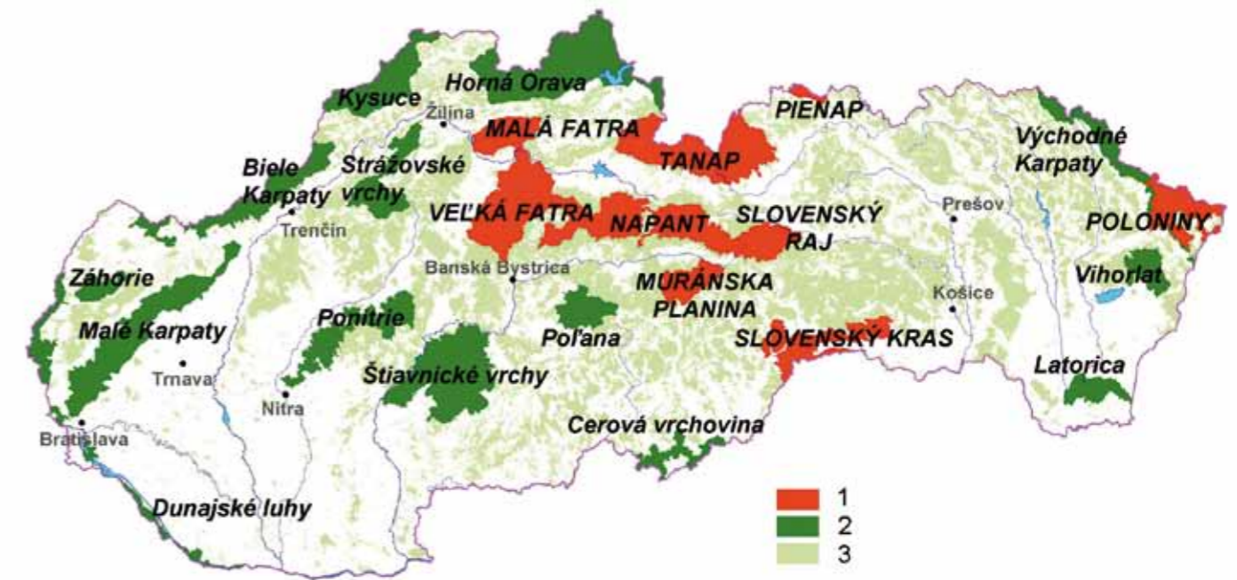
Národné parky a chránené krajinné oblasti v Slovenskej republike. Vysvetlivky: 1 – národný park, 2 – chránená krajinná oblasť, 3 – lesy