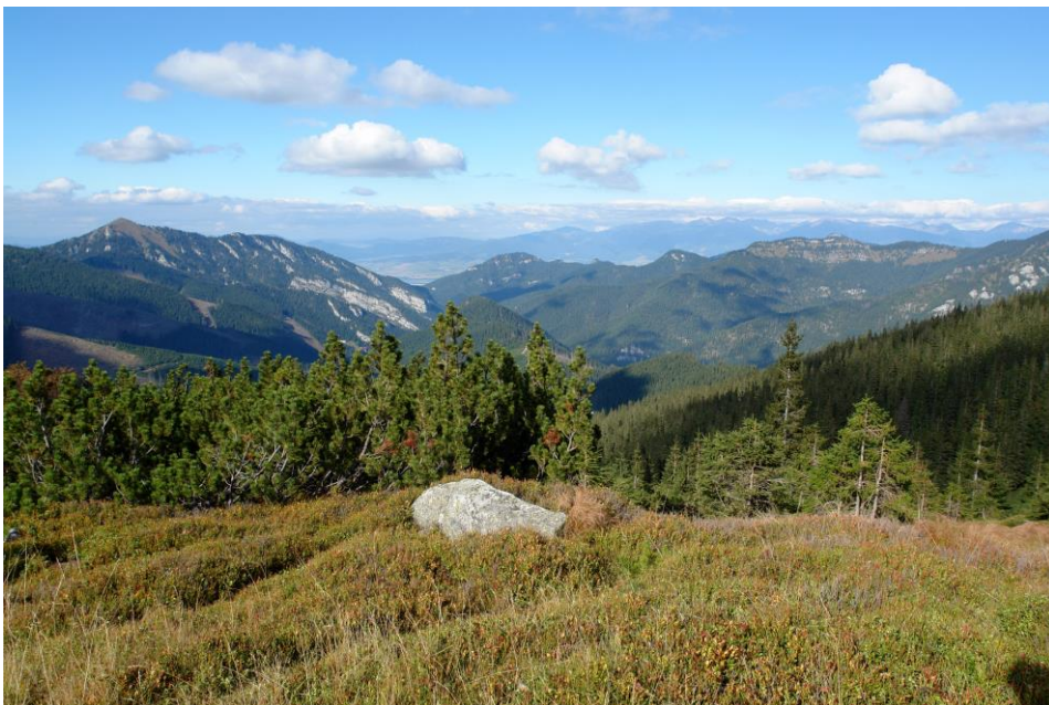
Obr. 2: Panoráma Demänovskej doliny – pohľad od Lukovej

Demänovské jaskyne zaradené na zoznam najvýznamnejších – národných prírodných pamiatok, ako aj ramsarských lokalít podľa Ramsarského dohovoru o ochrane mokradí. V sústave NATURA 2000 sú Nízke Tatry chráneným vtáčím územím územím európskeho významu.