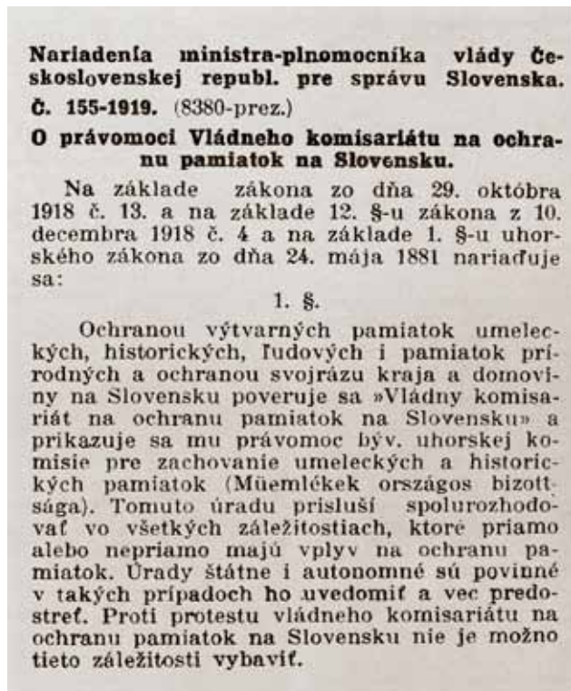
Obr. 2. Nariadenie ministra V. Šrobára o právomoci Vládneho komisariátu na ochranu pamiatok na Slovensku z roku 1919.

3542 o trestných sankciách na ochranu pamiatok (Úradné noviny, 1921, ročník 3, číslo 5).