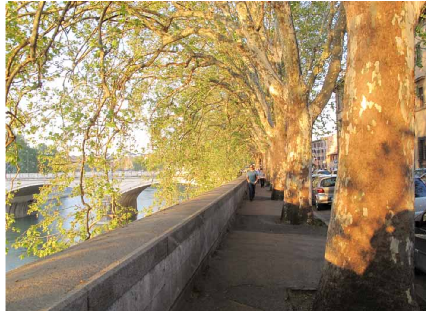
Nábřežie rieky Tiber v Ríme s alejou platanov ( Platanus x acerifolia ) tvorí multifunkčný zelený koridor mesta (Taliansko, 2013).