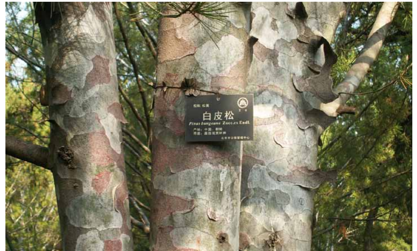
Pinus bungeana – ohrozený druh borovice pochádzajúci z Číny. Strom s exotickou kôrou sa odlupuje v nepravidelných plátoch a s dĺžkou ihlíc až 14 cm (Peking, 2011).