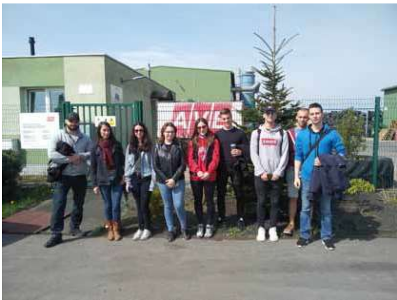
Obr. 3. Exkurzia v priemyselnom parku Kechnec. Návšteva závodu na recyklovanie pneumatík (Košice, 2019).

oboznámiť s vplyvom hospodárskej činnosti na životné prostredie (obr. 2 - 3), taktiež je tu možné implementovať princípy environmentálnej zodpovednosti na jednotlivé odvetvia národného hospodárstva so zohľadnením ich osobitností. Prepojenie s udržateľným rozvojom je tiež výrazne badateľné aj v študijnom zameraní Turizmus a hotelierstvo , kde sa pozornosť sústreďuje aj na aktuálne témy udržateľného rozvoja v turizme, ekohotelierstve či ekoturizme. Ďalšie predmety, v ktorých sú začlenené environmentálne témy sú: projektový manažment, marketing, manažment, manažment rizík a zmien, marketingová komunikácia, medzinárodný obchod a kultúra podnikania a iné. Získané teoretické vedomosti a poznatky študentov vyúsťujú do riešenia environmentálne zameraných záverečných prác.