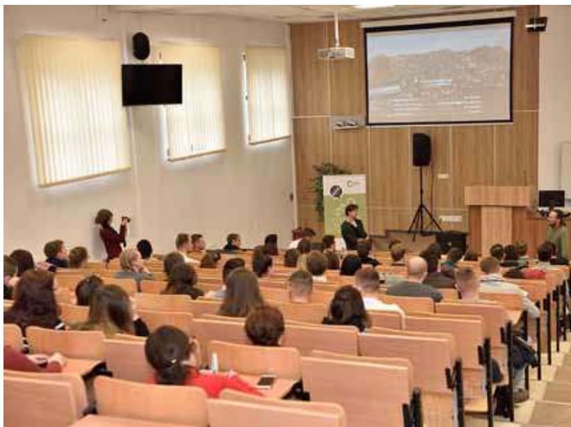
Obr. 2. Prednáška spoločnosti Priateľov Zeme, týkajúca sa problematiky produkcie odpadov a separovania (Prešov, 2019).

Veľký význam pri environmentálnom vzdelávaní je potrebné prikladať komunikácii s externým prostredím. Dynamika zmien – nielen legislatívnych či spoločenských – determinuje potrebu neustálych snáh o skvalitňovanie vzdelávania modifikáciou obsahov etablovaných predmetov i zavádzaním nových predmetov tak, aby na jednej strane reflektovali na aktuálne dianie v externom prostredí, aktuálne trendy vzdelávania a implementovania vedeckých výsledkov do edukačného procesu, na druhej strane treba tiež prihliadať na silnejúce snahy o maximalizáciu uplatniteľnosti absolventov v odbore. Nie je ambíciou predkladaného príspevku diskutovať o úplnej správnosti prispôsobovania vysokoškolského vzdelávania práve uvedenému atribútu (napr. pri neexistencii oficiálnych relevantných štatistík uplatnenia absolventov vo vyštudovanom odbore, rýchlej dynamike zmien vonkajšieho prostredia nekorelujúcej s dĺžkou prípravy kvalitných a komplexných modifikácií vzdelávania a pod.). Vzdelávanie však musí vytvárať takú kombináciu teoretic-